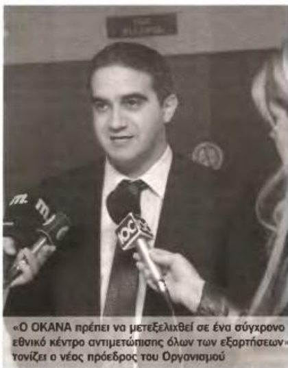
«Ο ΟΚΑΝΑ πρέπει να μετεξελιχθεί σε ένα σύγχρονο εθνικό κέντρο αντιμετώπισης όλων των εξαρτήσεων» τονίζει ο νέος πρόεδρος του Οργανισμού

Η διεύρυνση αρμοδιοτήτων και δράσεων προϋποθέτει πόρους. Πώς συνδυάζεται αυτό με