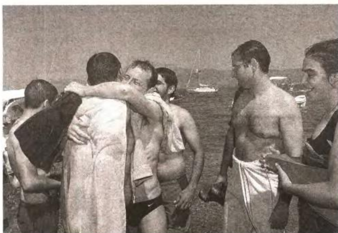
Το πέρασμα της Γέφυρας αποτελεί για τους μετέχοντες στο πρόγραμμα τη μεγάλη δοκιμασία (φωτ. από παλαιότερο πέρασμα)

Η οικονομική κρίση έχει συμβάλει στην αύξηση της χρήσης των εξαρτησιογόνων ουσιών, αλλά παράλληλα έχει βάλει σε δεύτερη μοίρα το θέμα της απεξάρτησης, παρ' ότι αποτελεί ζήτημα ζωής για κάθε χρήστη. Ο ΟΚΑΝΑ, υπό το βάρος των νέων συνθηκών, προσαρμόσε αναλόγως το πρόγραμμά του επιτρέποντας στα μέλη του θεραπευτικού προγράμματος να συνεχίζουν την εργασία τους, τις σπουδές τους και οποιαδήποτε άλλη ελεγχόμενη δραστηριότητα.