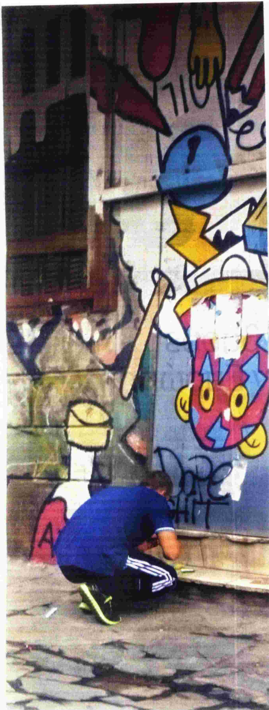
▲ ΟΙ ΔΡΟΜΟΙ δίπλα στην Ιάσονος στον Κεραμεικό θεωρούνται σταθερά κέντρα διακίνησης ναρκωτικών