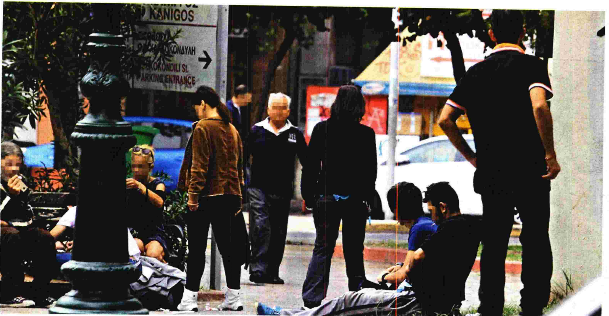
▲ Η ΠΛΑΤΕΙΑ ΚΑΝΙΓΓΟΣ έχει μετατραπεί σε στέκι τοξικομανών, που κάνουν χρήση μπροστά στα μάτια των περαστικών