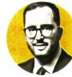
ΑΡΧΗΓΟΣ ΤΟΥ ΘΑΝΑΣΗΣ ΘΕΟΔΩΡΙΔΗΣ ΠΡΟΕΔΡΟΥ ΤΟΥ ΟΡΓΑΝΙΣΜΟΥ ΚΑΤΑ ΤΩΝ ΝΑΡΚΩΤΙΚΩΝ (ΟΚΑΝΑ)

Παγκόσμιο Ημέρα κατά των Ναρκωτικών, σε μια περίπτωση υπερβολικής δόσης ναρκωτικών, η οποία έλαβε χώρα εκτός του «ΣΤΕΚΙ 46». ΜΕΙΩΣΗ ΒΛΑΒΗΣ Υπενθυμίζεται ότι ο ιδιαίτερης σπουδαιότητας για την ευρύτερη κοινωνία, αλλά και για την ατομική υγεία των ίδιων των χρηστών ναρκωτικών πυλώνας της λεγόμενης «μείωσης της βλάβης» από τη χρήση ναρκωτικών εστιάζει ακριβώς στους ενεργούς χρήστες ψυχοδραστικών ουσιών. Μέσω του Δικτύου Άμεσης Πρόσβασης του ΟΚΑΝΑ επιτυγχάνεται η μείωση της βλάβης και του κινδύνου από τη χρήση ουσιών. Πρόκειται για το πρώτο στάδιο της προσέγγισης του πληθυσμού-στόχου των ουσιοεξαρτημένων. Απώτερος σκοπός είναι ο περιορισμός της βλάβης που προκαλεί η εξάρτηση, η διασφάλιση καλύτερων συνθηκών διαβίωσης, η αναβάθμιση της ποιότητας ζωής, με την κάλυψη βασικών αναγκών των χρηστών, καθώς και η διασύνδεση και η ένταξη τους σε θεραπευτικό πρόγραμμα υγείας. Επίσης, μέσω της μείωσης της βλάβης επιτυγχάνεται η προώθηση της ευρύτερης δημόσιας υγείας και ο περιορισμός της διασποράς μεταδιδόμενων λοιμωδών νοσημάτων. Στο πλαίσιο, λοιπόν, της μείωσης της βλάβης εντάσσεται και η λειτουργία του ΧΕΧ.