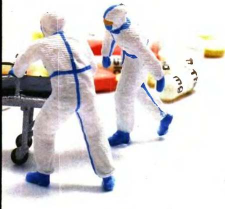
Επισκέπτες για ασφαλέστερη χρήση (ενέσιμη ή εισπνεόμενη) Σύνολο: 676